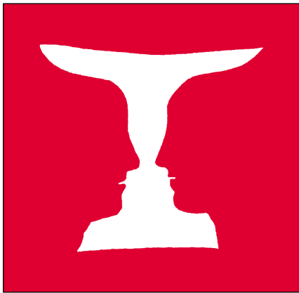
Figure 2. Interdépendance des gènes et de l'environnement dans lequel ils s'expriment. Cette figure peut suggérer la complémentarité difficilement saisissable d'un gène et de son environnement : le gène correspondrait à la partie blanche de l'image, qui a la forme d'un vase. La partie rouge correspondrait à l'environnement dans lequel ce gène s'exprime. Mais si l'on prend en compte la partie rouge (l'environnement), apparaît alors le profil de deux visages humains, face à face, sur fond blanc. Il n'est pas possible de voir simultanément le vase et les profils. Définir la totalité des propriétés d'un gène équivaudrait ici à percevoir simultanément les deux significations de l'image. (D'après Edgar Rubin, psychologue, 1915.)

que celles-ci exercent entre elles sont probablement le reflet d'une longue histoire évolutive. Comme plusieurs auteurs l'ont justement relevé, l'apparition de la complexité des interactions entre gènes est certainement le résultat du concept de « l'évoluabilité » de formes de vie ancestrales [1]. Selon ce concept, les espèces actuelles qui nous apparaissent comme les plus évoluées doivent leurs caractéristiques à la capacité qu'ont développé leurs ancêtres de se modifier et de s'adapter. Lorsque nous apprenons la capture, par quelque chercheur, d'un nouveau gène important chez notre propre espèce, beaucoup d'entre nous ne réalisent pas à quel point un tel gène n'est généralement pas une particularité propre à l'homme, mais se trouve en réalité avoir été transmis à