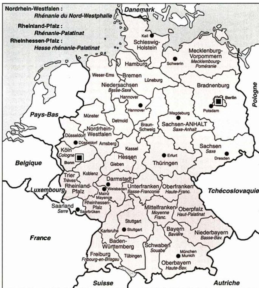
Figure 1. Allemagne. Carte des Länder et des Regierungsbezirke.

de l'ancienne RDA. Les six Länder les plus peuplés sont divisés en 26 arrondissements ( Regierungsbezirke ), soit en tout, avec les quatre Länder de l'Ouest non divisés et les cinq de l'Est, un total de 36 arrondissements, chiffre peut-être susceptible d'être