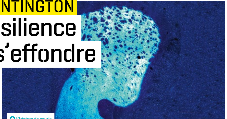
❧ Striatum de souris

❧ Dans la maladie de Huntington, alors que la mutation du gène de la huntingtine est exprimée par toutes les cellules du cerveau, elle est spécifiquement toxique pour les cellules du striatum (ici, de souris).