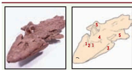
Figure 1. Spécimen de Tiktaalik roseae avec son schéma interprétatif. 1 : orbites ; 2 : spiracle ; 3 : mandibule ; 4 : ceinture scapulaire ; 5 : nageoires antérieures.