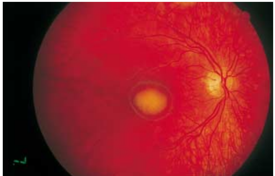
Figure 3. Fond d'œil et angiographie de maladie de Best au stade de disque vitelliforme. Notez la tache centrale maculaire qui correspond à un dépôt de matériel vitellin, encore appelé en «œuf sur le plat», car très en relief au biomicroscope.

La fréquence de cette affection est mal connue et sans doute sous-estimée car son diagnostic est mal aisé à un stade tardif, c'est-à-dire au stade atrophique le moins spécifique. Pour