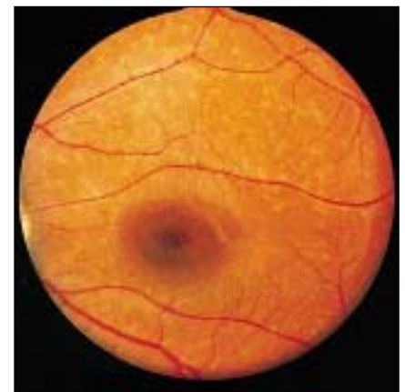
Figure 1. Fond d'œil caractéristique d'une maladie de Stargardt. Noter l'aspect granité, dépoli, au centre de la rétine, dans la région maculaire. En zone pérимaculaire, on peut observer des taches blanchâtres, diffuses, dites flavimaculées.

visualiser un léger granité maculaire. En outre, les signes d'accompagnement sont inexistant (pas de photophobie, pas de dyschromatopsie). Aussi l'enfant est-il souvent considéré comme un simulateur et cela d'autant plus que l'affection apparaît à l'âge de l'apprentissage de la lecture, ce qui a conduit certains patients vers des classes de perfectionnement pour enfants en difficultés scolaires! En quelques mois, toutefois, le fond d'œil va devenir évocateur en montrant des remaniements pigmentaires de la région fovéolaire à type d'atrophie de l'épithélium pigmentaire de la région maculaire. Autour de la macula, sont observées, dans un grand pourcentage de cas, des taches blanchâtres appelées fundus flavimaculatus ( figure 1 ) [4, 5]. A ce stade, les examens complémentaires sont très importants. (1) L'angiographie en fluorescence confirme le diagnostic par la présence de trois signes majeurs: (a) un aspect dit en « œil de bœuf » qui correspond à l'alternance de zones de masquage et d'effet fenêtre dans la région maculaire; (b) un silence choroïdien qui correspond au masquage du pommelé choroïdien; et (c) la présence de taches flavimaculées pérимaculaires hyperfluorescentes ( figure 2 ). (2) Le relevé du champ visuel met en évidence un scotome central alors que le champ visuel périphérique est normal. (3) Et surtout l'électrophysiologie est stricte-